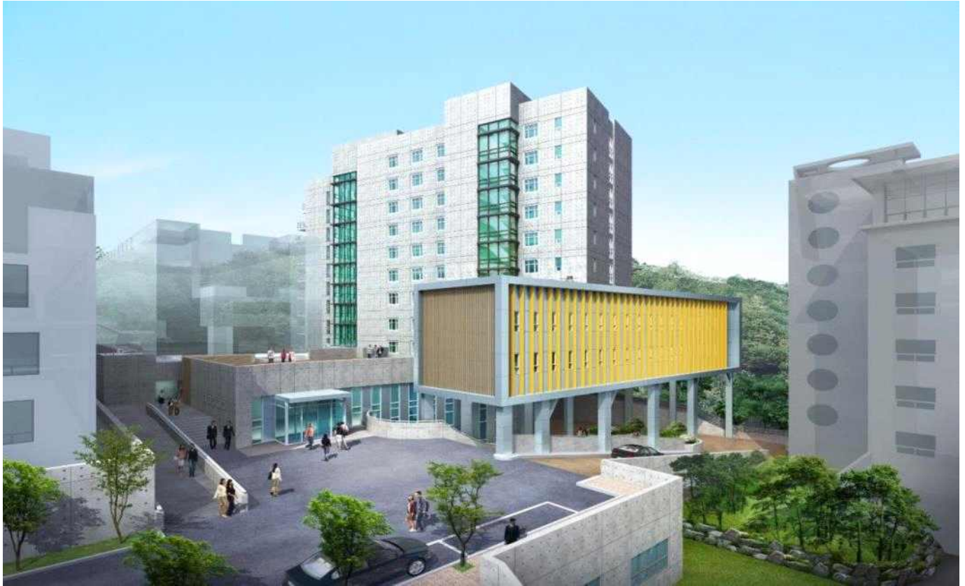
※ 행복기숙사 조감도

*행복기숙사 입사 및 사내 시설 등 자세한 사항은 추후 홈페이지를 통해 공지할 예정